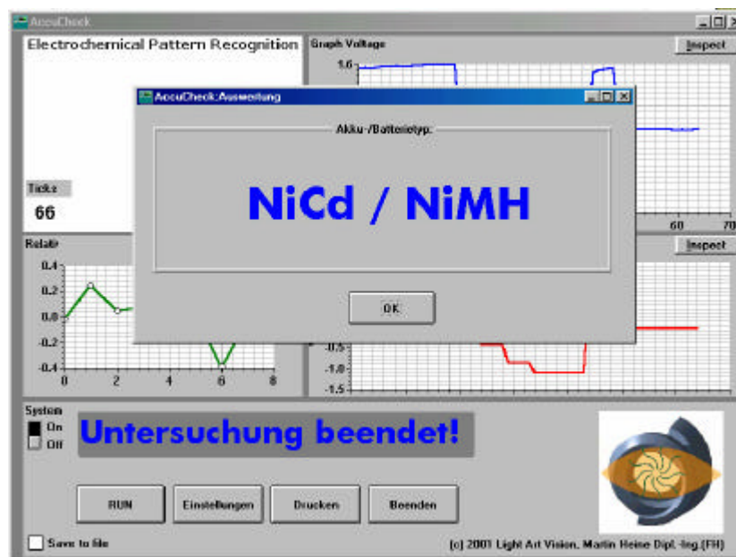
Bild 1 Grafische Bedienerschnittstelle des Demosystems

Elektrochemischen Vorgänge wie z.B. in Akkus, Batterien und Brennstoffzellen sind sehr komplex. Nicht nur die Erfassung der Vorgänge beim Laden und Entladen sind von Interesse, (z.B. die Erkennung wann ein Akku voll ist), sondern vor allem auch die automatische Erkennung und Charakterisierung von Alterungsprozessen und Nebeneffekten ist von großer Bedeutung. Gerade bei automatisierten Produktionsprozessen und der Fernwartung von elektrochemischen Systemen, die schwer zugänglich sind, wie externe Telemetrie-Messeinrichtungen oder Satelliten, ist eine Zustandsdiagnose oft unumgänglich. Das folgend beschriebene System ist ein Rechnergesteuertes ECPR Meßsystem ( Electrochemical Pattern Recognition System ) zur schnellen Diagnose von Akkumulatoren und Batterien über empirische Stimulations- und Mess-Algorithmen. Zur Demonstration und zum besseren Verständnis dieses Systems wird die Erkennung der Chemie eines Akkus bzw. einer Batterie gezeigt.