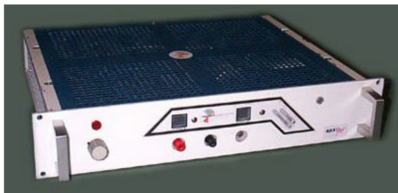
Bild 2 Demonstrationsgerät