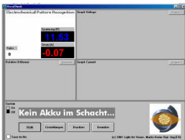
Bild 3 System gestartet und bereit

Nach Anschluß eines Akkus oder einer Batterie erkennt das System automatisch, dass ein elektrochemisches System angeschlossen ist. Nun wird mit speziellen Messreihen die angeschlossene elektrochemische Energiequelle untersucht. Das Resultat wird in Form von Klartext zur Demonstration angezeigt. Folgende Illustration zeigt den Erkennungsprozess einer Alkali-Mangan Zelle in ca. 60s.